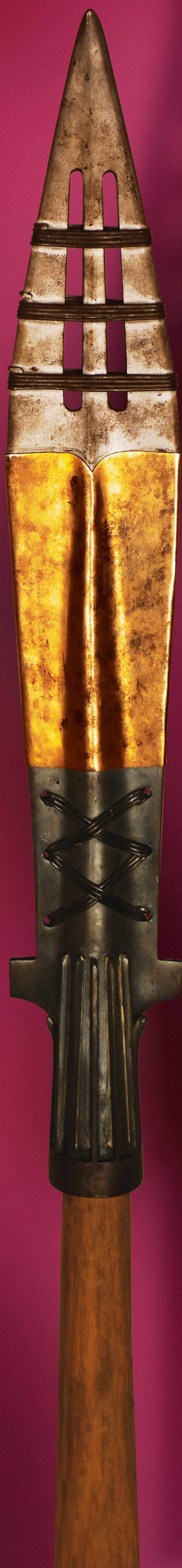
Kopia włóczyń św. Maurycego