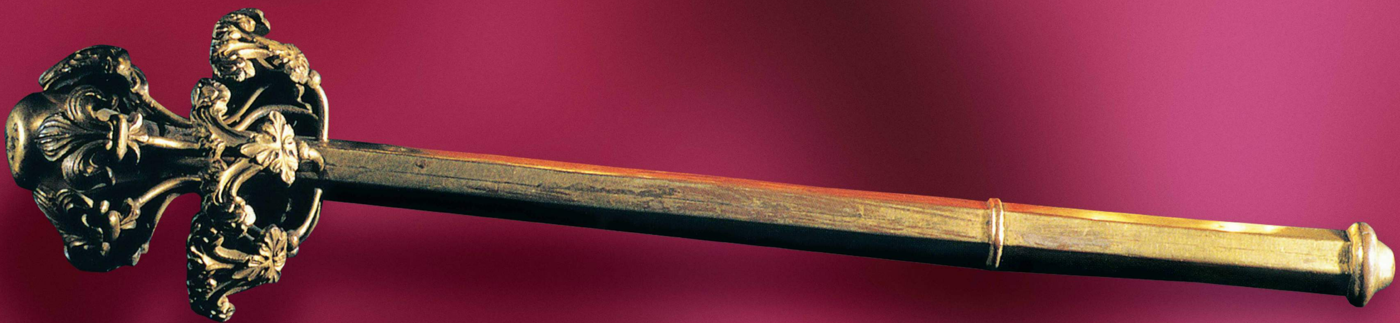
Kopia berła Kazimierza Wielkiego

Berło stanowić mogło także odpowiednik maczugi z okrągłą głowicą, która poza tym, że była rodzajem broni obuchowej, stanowiła m.in. w starożytnej Mezopotamii czy Egipcie, symbol władzy. Wywodzące się od maczug, a rozpowszechnione w Europie dzięki ludom nomadzkim, średniowieczne i nowożytnie buławy, zaopatrzone w metalowe głowice, niekiedy bogato zdobione, były znakiem dostojęstwa wojskowego. W Polsce posługiwali się nimi hetmani w XVI-XVIII w., a w XX w. – marszałkowie.