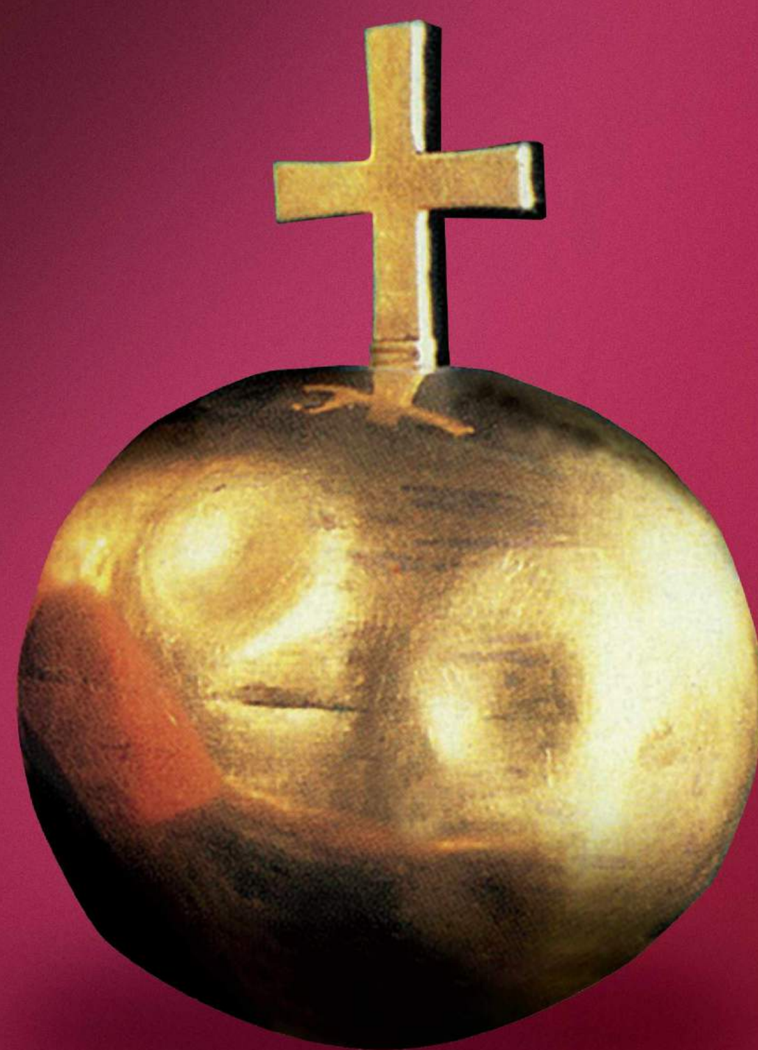
Kopia jabłka królewskiego Kazimierza Wielkiego

Pierwszym polskim władcą, który użył jabłka podczas koronacji był Przemysław II w 1295 r. Jeszcze w 1792 r. (podczas ostatniej lustracji) w Skarbcu Koronnym na Wawelu znajdowało się pięć jabłek królewskich, w tym najokazalsze-koronacyjne wykonane ze złota, zwieńczone krzyżykiem z pereł i rubinów, z wygrawerowaną na globie mapą świata, przekazane przez króla Jana Kazimierza. W późniejszym czasie zawartość skarbcza została rozgrabiona i zniszczona przez zaborców.