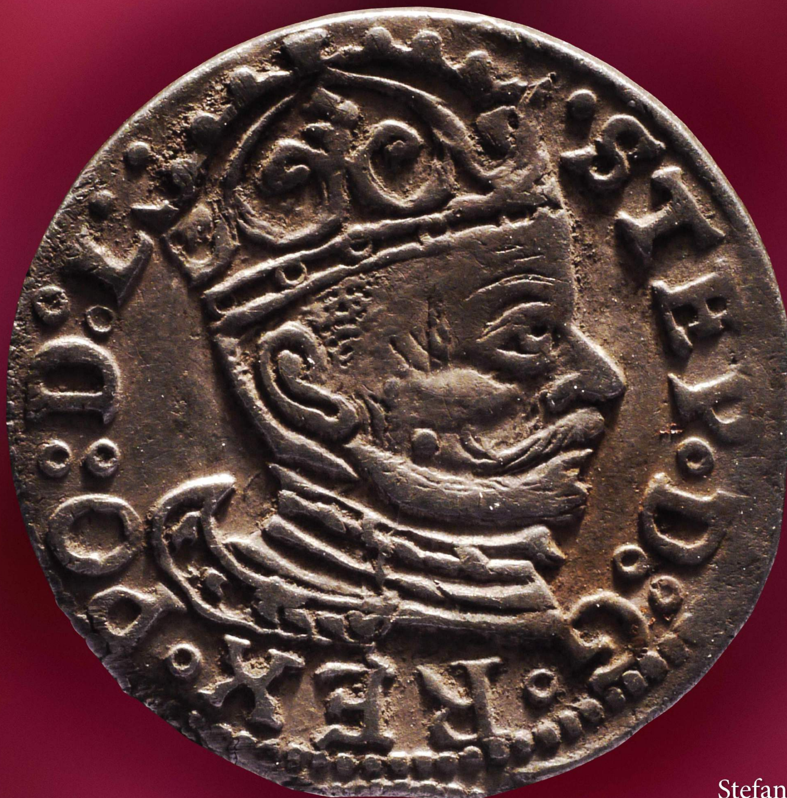
Stefan Batory (1576-1586), trojak 1583, mennica Ryga