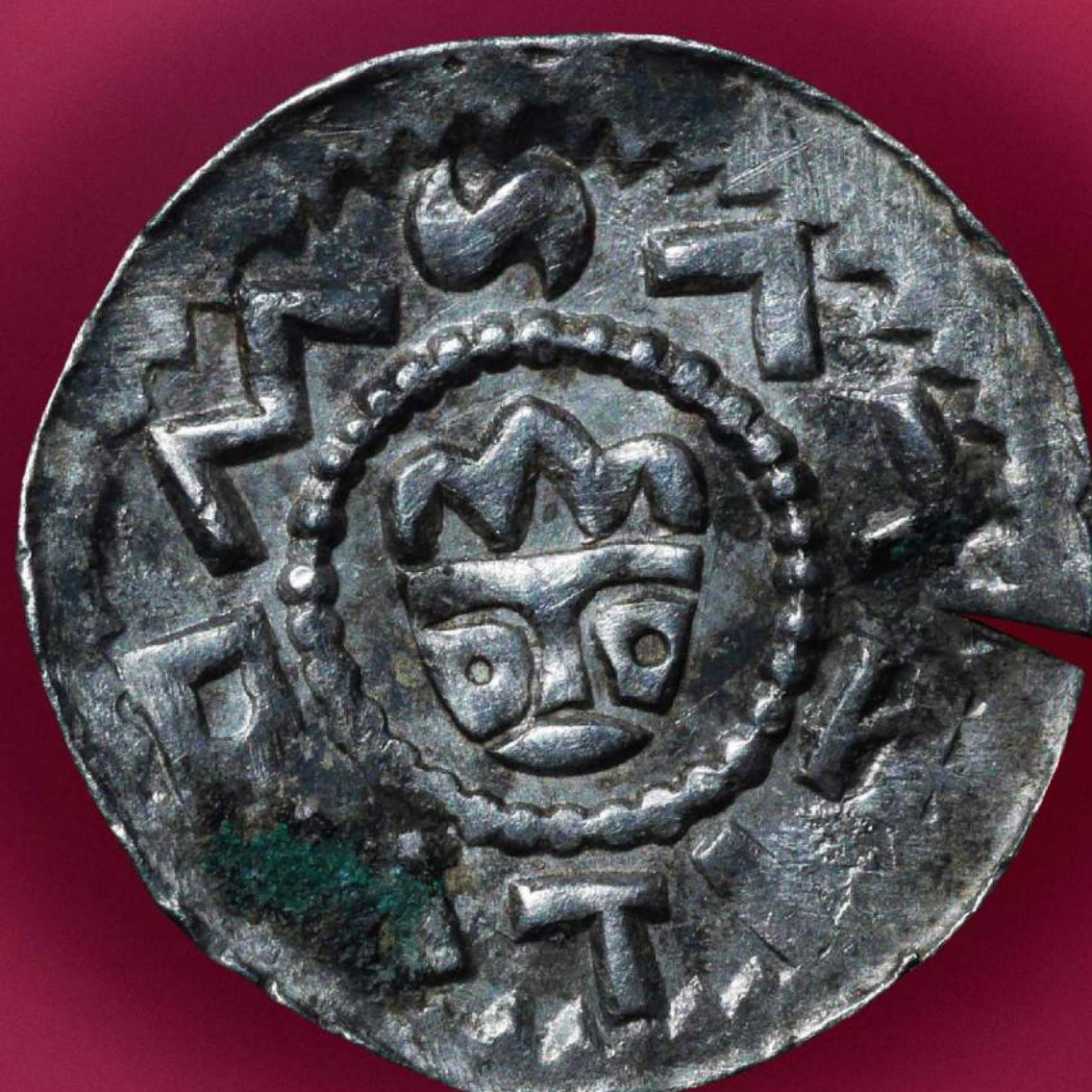
Moneta z wizerunkiem władcy – Denar Wratysława II

Znaki władzy umieszczane były na różnych przedmiotach. Wśród nich ważną rolę odrywają masowo emitowane monety, na których ukazywano różnego typu wyobrażenia mające przede wszystkim znaczenie propagandowe i informacyjne. Przekazem bardziej elitarnym, docierającym do węższej grupy społecznej, były przedstawienia na pieczęciach. Z kolei znaki herbowe, które odnajdujemy powszechnie w rozmaitych miejscach w przestrzeni publicznej i prywatnej zajmowały szczególne miejsce w ideologii władzy towarzysząc wizerunkom władców, a z czasem niejednokrotnie je zastępując.