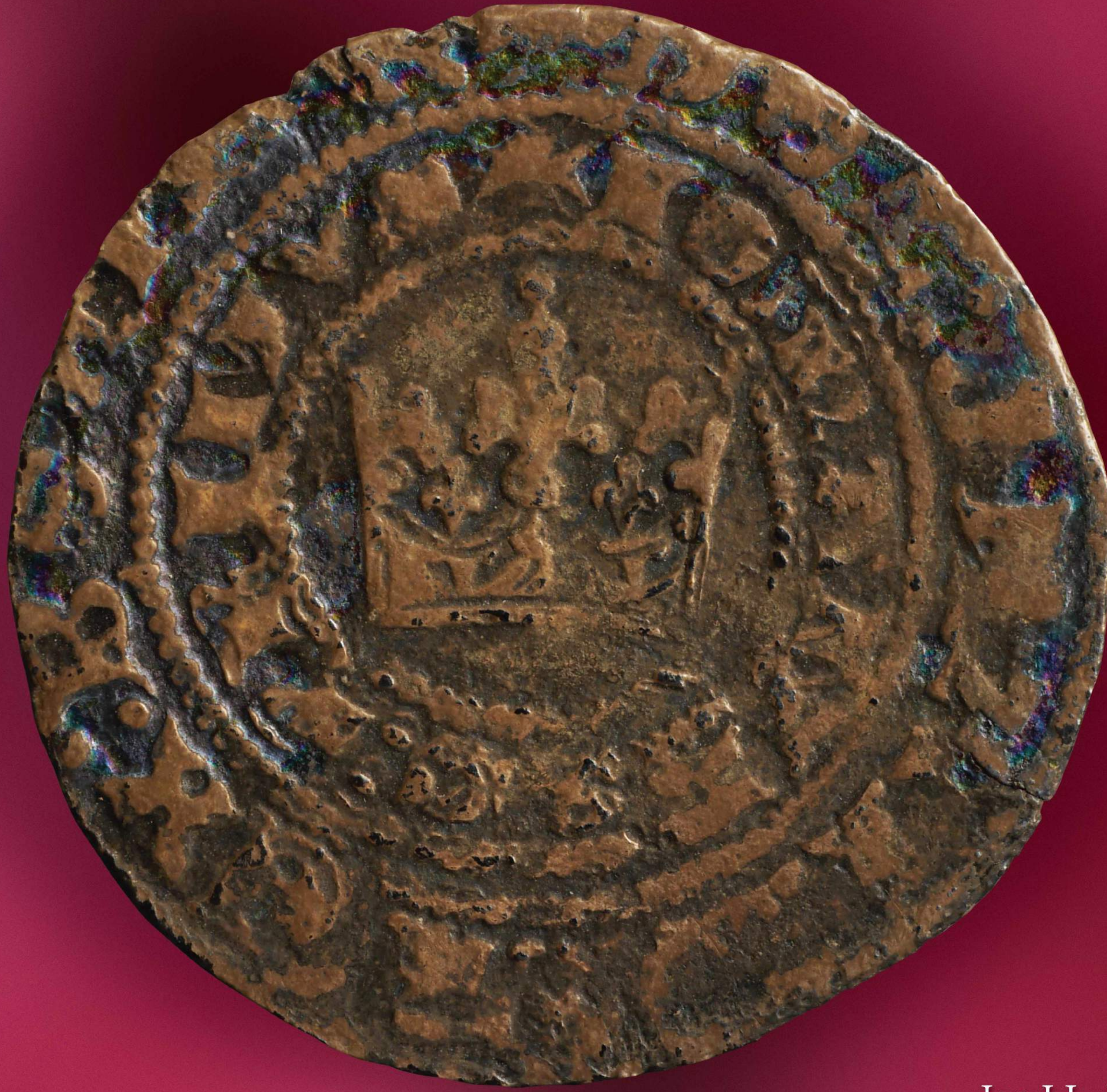
Jan I Luksemburski (1310-1346), grosz praski ok. 1340