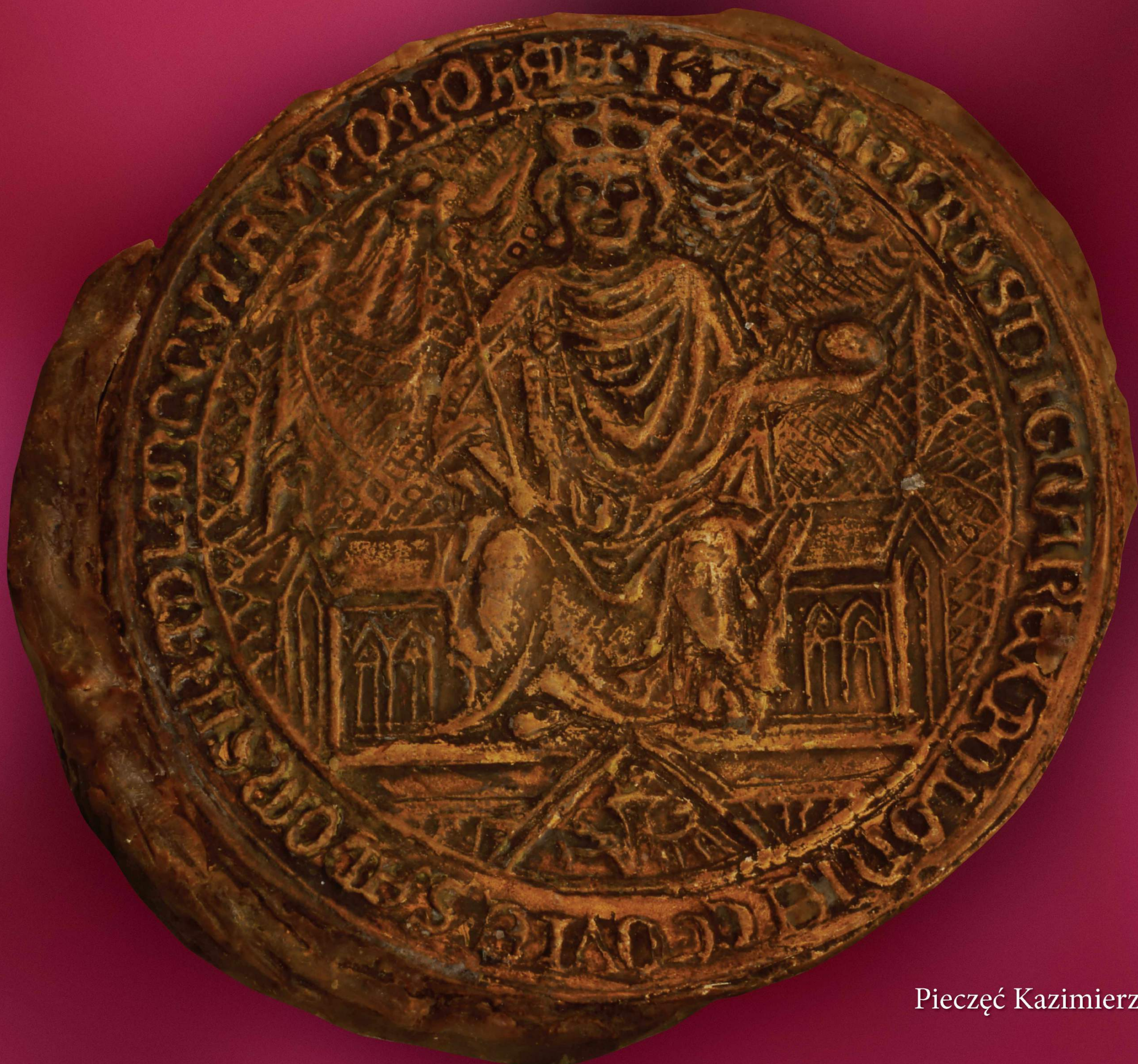
Pieczęć Kazimierza Wielkiego

Na prezentowanej pieczęci majestatycznej Kazimierza Wielkiego, dołączonej do dokumentu z 1370 r., ukazano króla w ceremonialnym stroju siedzącego na tronie skrzyniowym. W prawej ręce monarcha trzyma berło, a w lewej jabłko zwieńczone krzyżem. U stóp władcy ukazano herb książąt kujawskich. Ikonografia pieczęci, nawiązując do uniwersalnej symboliki, określa pozycję, charakter i zakres sprawowanej władzy królewskiej.